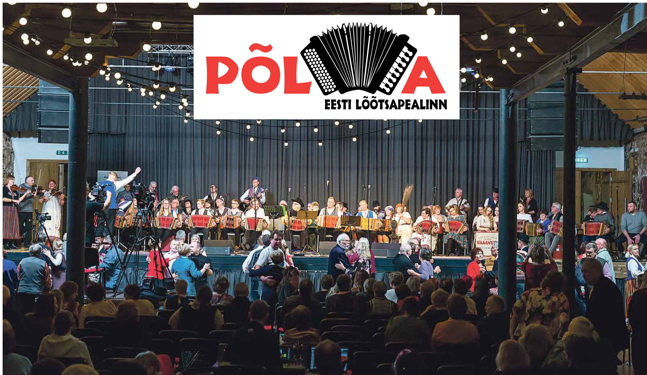
Lõotsapealinn Põlva 8. sünnipäeva simman Mooste Folgikojas.