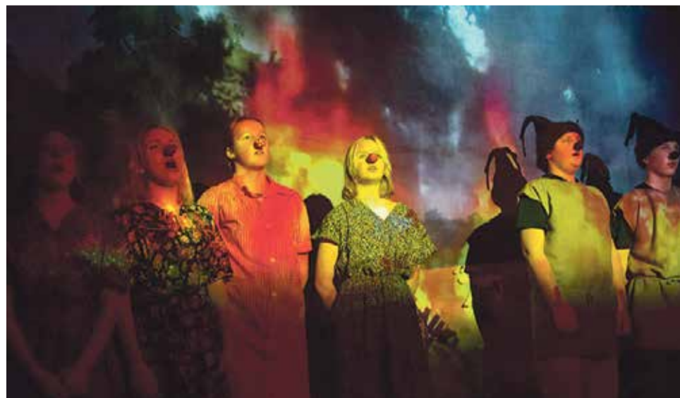
Kilpla on leekides.