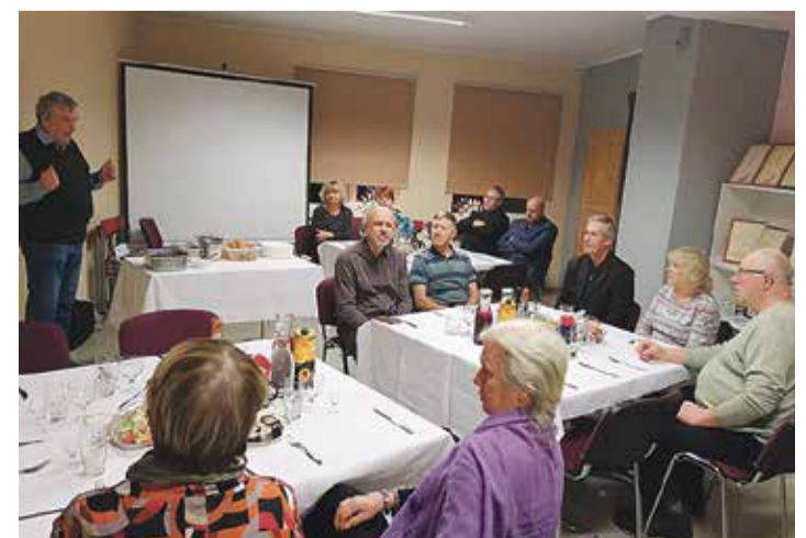
Leevijõe küla aastakoosolek.