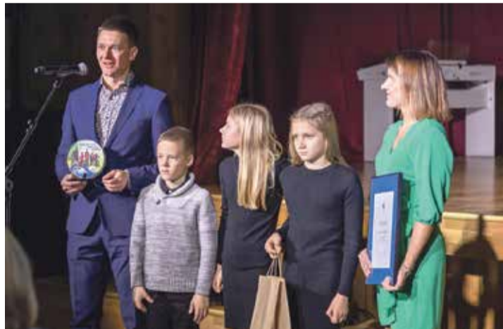
Aasta sportlikuim perekond - perekond Avikson.