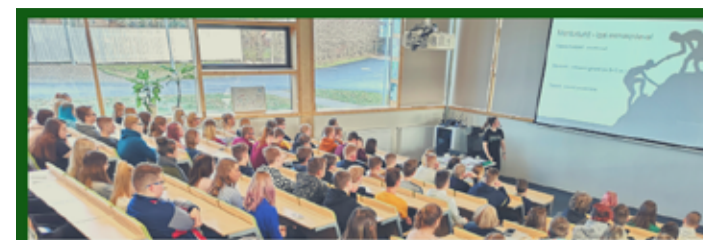
Pildil 1. klassi hiirekesed

Põlva Gümnaasium ja Eesti Töötukassa Põlvamaa esindus kutsuvad