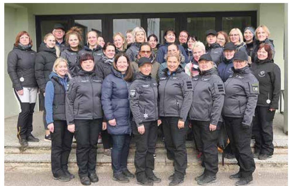
Põlva ringkonna EVAK rühm.

Päeva lõpus tegime kokkuvõtteid ning maleva pealik kordas üle olulisemad asjad, millele edaspidi rohkem tähelepanu pöörata.