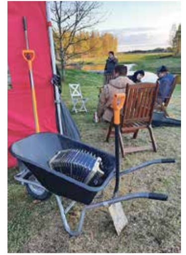
Fotol: Talgupäeva järgne hetk Kanassaare külaplatsi esimesel peol.

Peale töökat talgupäeva ei jäänud loomulikult ka rajatud külaplatsi esimene pidu pidamata. Kanassaarlased töid ühisele peolauale kaasa head-paremat, pillioskajad mängisid tuntud lugusid ning julgema laulsid kaasa. Räägiti jutte ja lugusid, ammusemad ja uuemad külaelanikud said tutvuda. Kuigi külas on ka mitu aastat tagasi ühistegevusi toimunud, ei olnud varem sellist kokkutulemist kohta. Muidugi on veel palju ühiseid töid ja tegemisi ees ootamas, kuid Kanassaare kogukonnale on oluline algus tehtud. Aitäh kõigile, kes panustasid. Järgmine kord juba varsti ja veel ägedamalt!