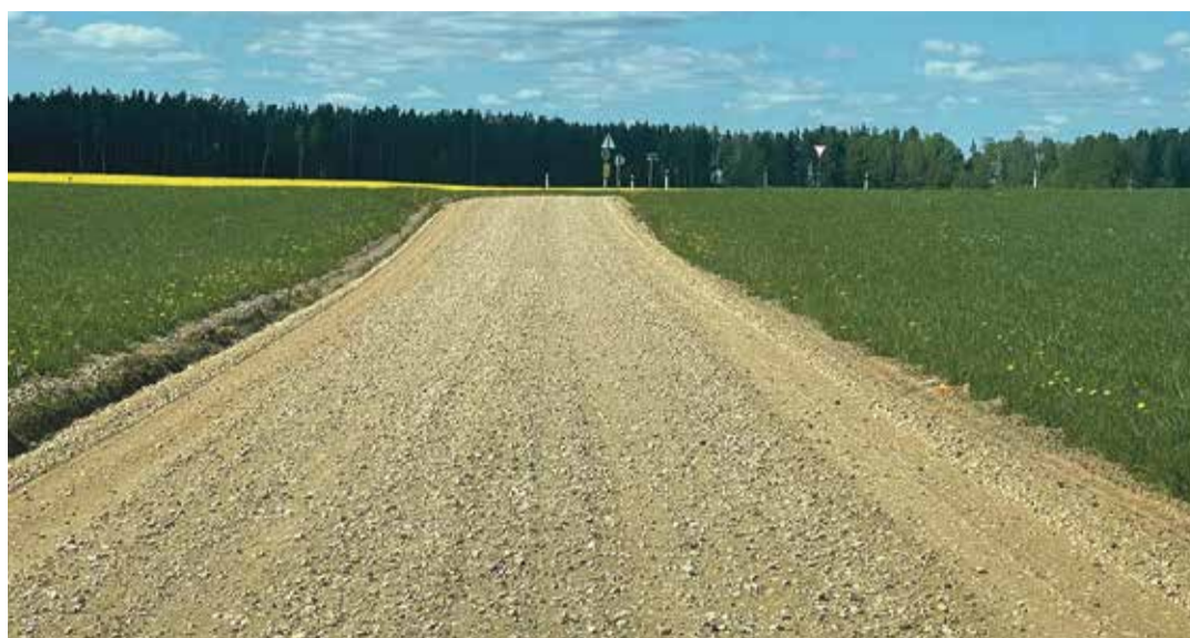
Värske kate saanud Metsanurga tee Himmastes.

2022. aastal riigi poolt eraldatud transiittee toetuse raames remonditakse sel aastal Partsi – Meemaste tee ca 5 km pikkune lõik. Kui pikalt tee täpselt toimuvabaks saab, selgub pärast riigihanke tulemuste teada saamist. Lisaks ehitatakse tolmuvabadeks kaks ca 250 meetrist