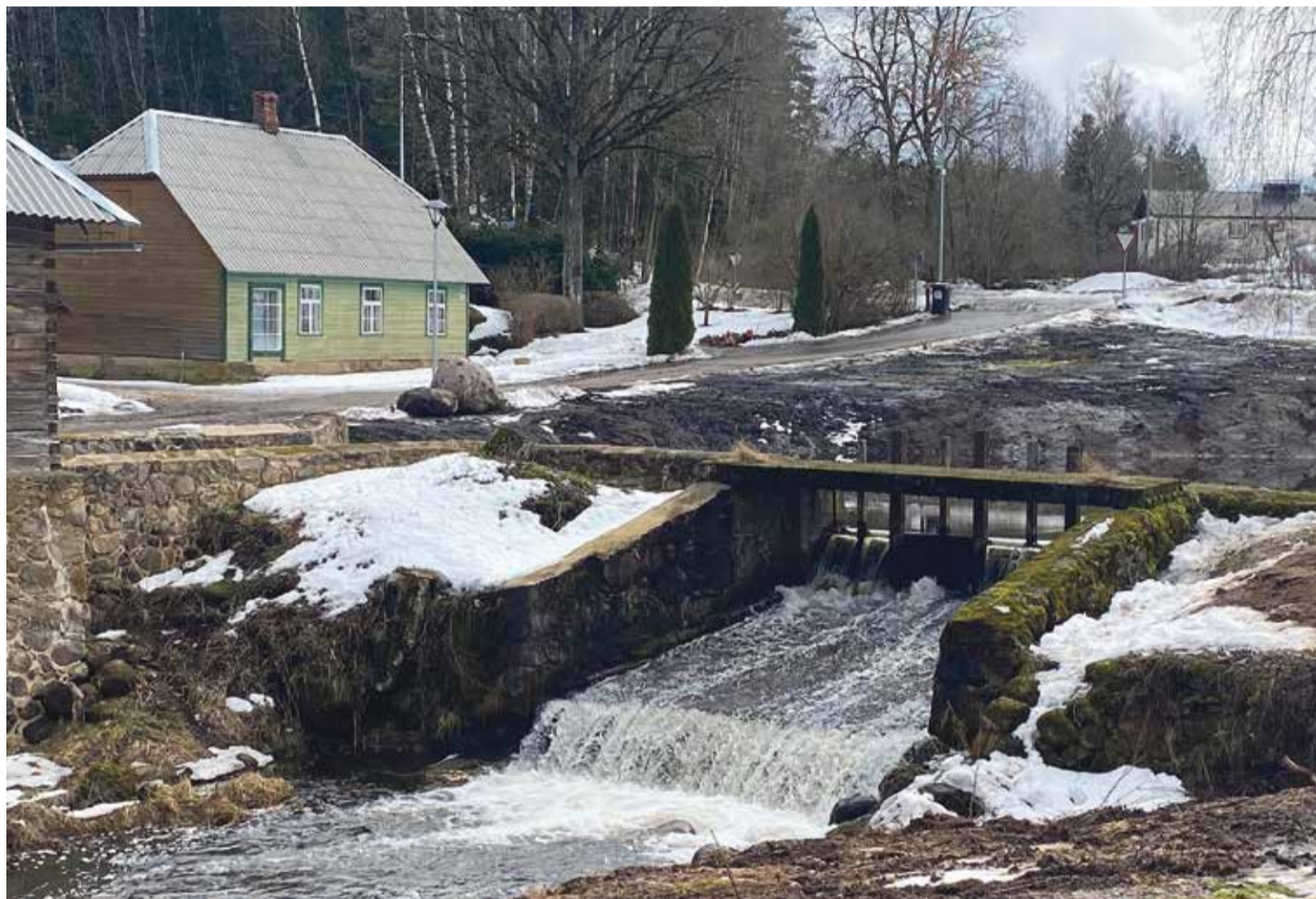
Rosma vesiveski pais. 2020. aasta kaasava eelarve raames puhastati ja süvendati Rosma vesiveski paisutiik, korrastati kaldad ja eemaldati võsa.