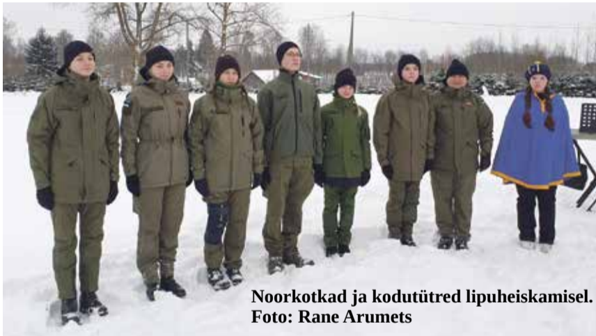
Noorkotkad ja kodutütred lipuheiskamisel.

Vaatamata tuulisele ja sajusele ilmale toimus 18. veebruaril Tännassilma külaplatsil ka tore ja sportlik vastlapäev. Meeskondlikes mängudes