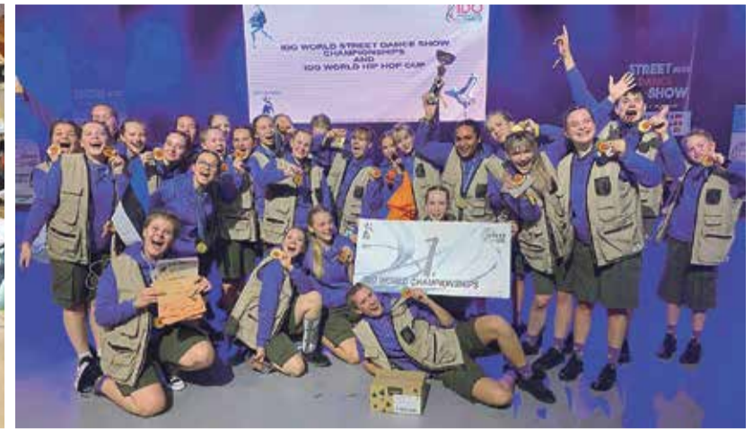
Põlva Mini kids rühm ja Võru Tantsukeskuse 12-18 aastaste rühm koos Põlva tantsijatega

Põlva Spordi- ja Tantsukool "Meie Stúdio" ja Võru Tantsukeskus osalesid IDO World Street Dance Show Championships võistlustel Sloveenias, mis toimus 13.-15. novembril 2023 Laskos.