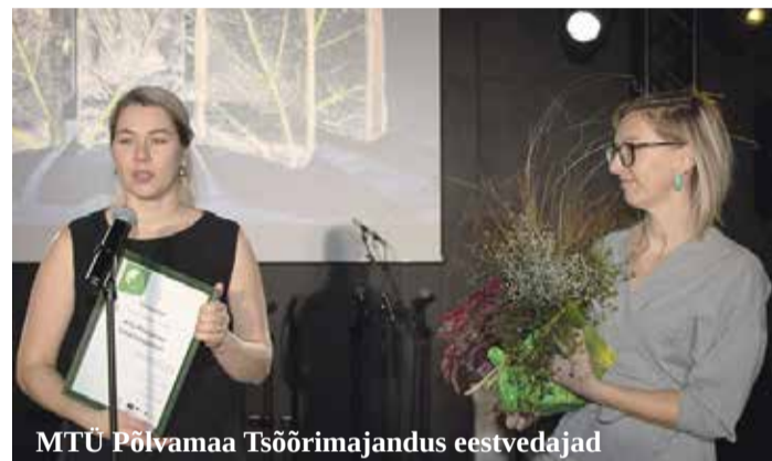
MTÜ Põlvamaa Tsõõrimajandus eestvedajad