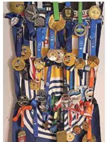
Võistlustel saadud medalid