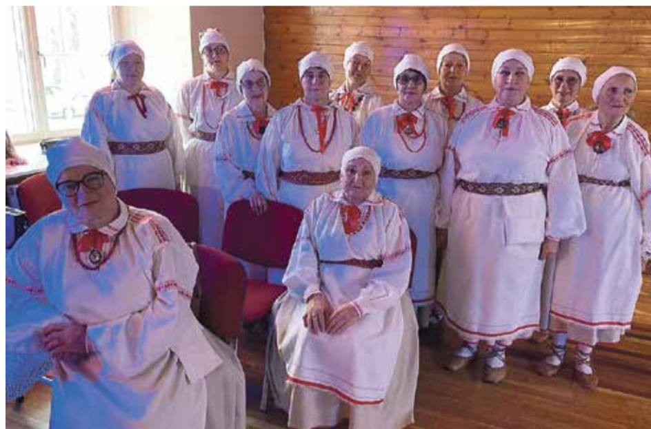
Rahvatantsurühm Hõbesõlg 30. aastapäeva tähistamisel.