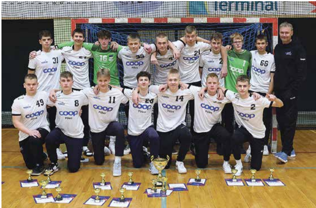
Põlva noormeeste A-vanuseklassi võiduvõistkond.

• 27.–29. oktoobril toimusid Põlvas noormeeste A-vanuseklassi karikavõistlused käsipallis. 2005. aastal ja hiljem sündinud poisid võistlesid seitsme meeskonna konkurentsis. Põlva Spordikooli võistkond võitis kuldse karika.