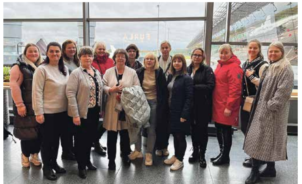
Põlvamaa lasteaiaõpetajate delegatsioon.

miseks. Väärtustatakse suhtlemisoskust ja empaatiavõimet, oskust juhtida oma emotsioone ning käitumist.