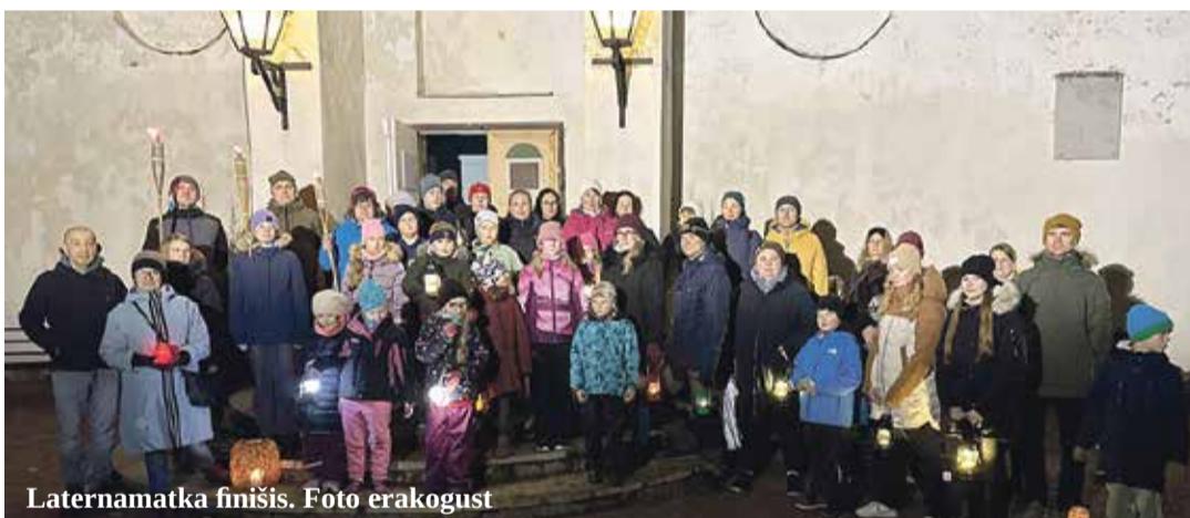
Laternamatka finišis.

Valmistasime ette toreda ja põhjaliku kava sanditamise rituaale silmas pidades. Riieusime ka nagu kord ja kohus ikka ainult tumedatesse riidesse, kandsime maske. Lauluga