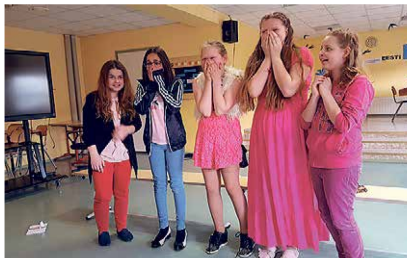
Põlva Kooli 4. klassi tüdrukud tutvustavad Reeli Rainausi raamatut „Roosad inglid“.

Krootuse Põhikooli 5. klassi poisid tutvustasid vaimuka esitluse ja vahvate rekvisiitide abil Vitezslav Nezvali raamatut „Asjad, lilled, loomad ja inimesed lastele“. Viluste Põhikooli 6. klassi õpilaste hoogne teatraliseeritud etteaste tõi vaatajateni Detektiiv, Vaarao, Printsessi, Piraadi, Rooma sõduri, Astronaudi ja Spiooni käsiraamatuid. Selgus, et ka käsiraamat saab olla üks väärt lugemisvara! Saverna Põhikooli 5. klass tutvustas Markus Saksatamm juttu „Saladuslik kala“ raamatust „Viieküüruline kaamel ja teisi naljajutte“. Etteaste oli lõbus ja kaasahaarav. Vastse-Kuuste Kooli 6. klassi õpilased esitasid kokkuvõtte Christine Nöstlinger raamatust „Vahetuslaps“.