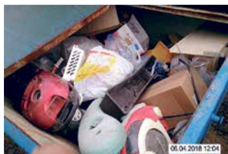
Foto: Eesti Keskkonnateenused AS. Paberi ja kartongi konteinerisse on pandud sinna mittedobivad prügi.

Pikk talv on selja taga ning ees ootab suur suvi. Kevadiste koristuste periood on alanud, mistõttu tahame inimestele meelde tuletada, et avalikult kasutatavad prügikonteinerid on kindlate jäätmete jaoks. Paberi ja kartongi konteinerisse ei tohi panna vanu elektroonikaseadmeid, rattaid või olmeprügi!