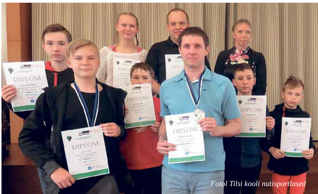
Fotol Tilsis kooli nutispordlast

Veel üks väga oluline viimaste kuude sündmus ning suur väljakutse oli Nutispordi Kagu-Eesti finaali korraldamine. Kuna Tilsis koolist oli Nutispordi finaali pääsejaid lausa 19, siis langeski finaali läbiviimise au meie koolile. Kokku oli Kagu-Eestist 60 nutispordlast, kes võtsid mõtu matemaatilistes teadmistes. Meil võõrustajate-na läks üsna hästi – 19 osalejast said medali kaela 13. Tilsist pääses 6 õpilast ja 3-liikmeline