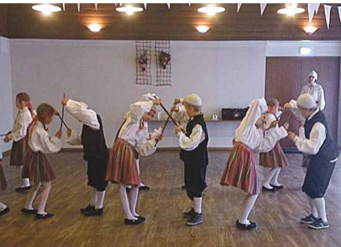
Hoos on rahvatantsuringi tantsijad.

24. mail 2017 peeti Himmastes Põlva valla koolide folkloorifestivali, seekord juba seitsmendat korda.