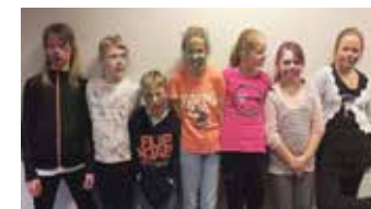
Halloweeni õudusmeigi õpitubas osalejad.

Aasta lõpuni saab noortekeskuse seminariruumis keskuse lahtiolekuaegadel nautida sama programmi fotokoolituse esimese lennu