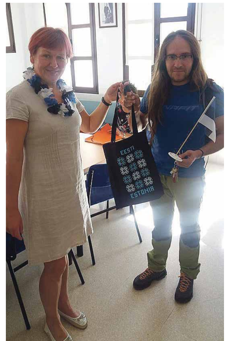
Ene Veberson üle andmas kingitust.

Edukaid õpirände projekte 2018. aastal kõigile Põlvamaa koolidele!