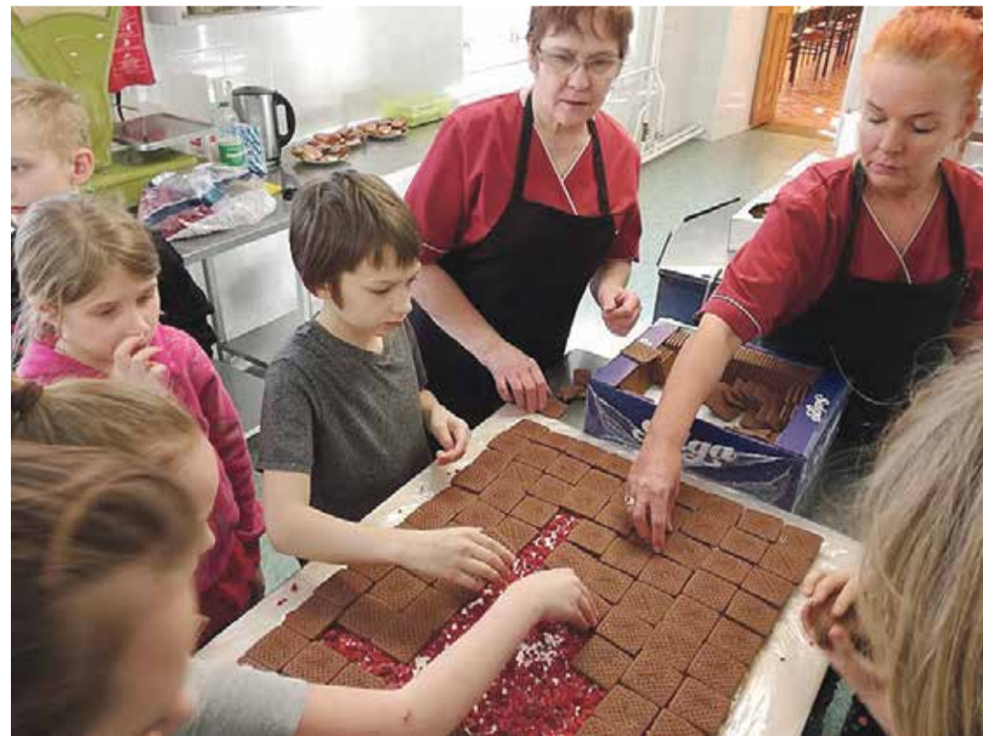
Ahja noored EV100 torti valmistamas.

Ahja Vabaaja- ja Noortekeskus osales LEADER meetme ühisprojekti „Piirkonna toitumisteadlikkuse ja Ahja noorte ettevõtlikkuse ergutamine”. Kaheaastase projekti partneriteks olid veel Ah-Ja publi ja Ahja Kool.